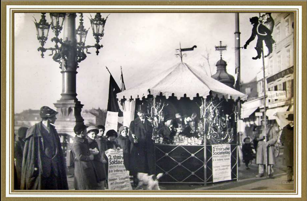
2. steirischer Soldatentag (5. Dezember 1915)