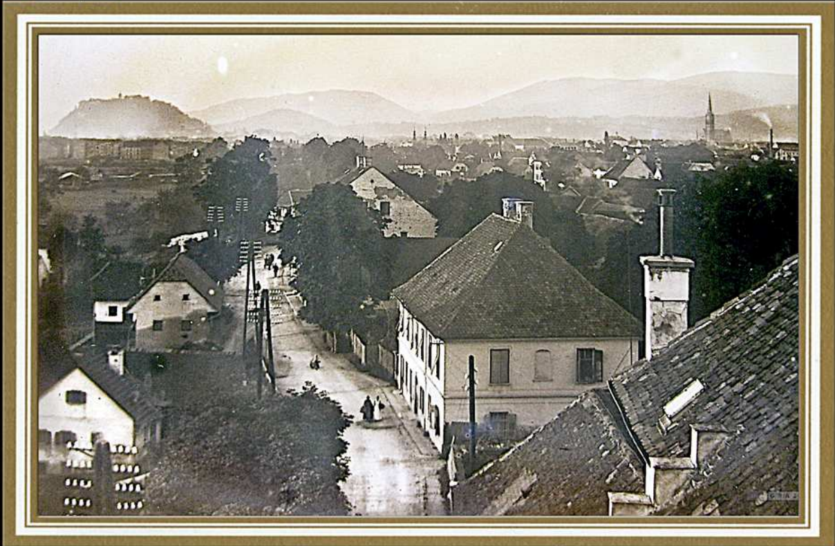
Blick vom Turm des Schlosses Harmsdorf