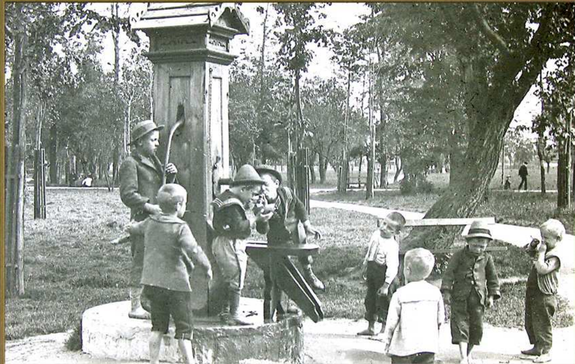
Brunnen im Augarten