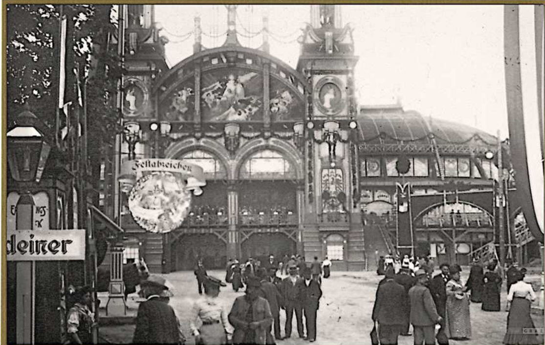
Sängerkongress im Juli 1902