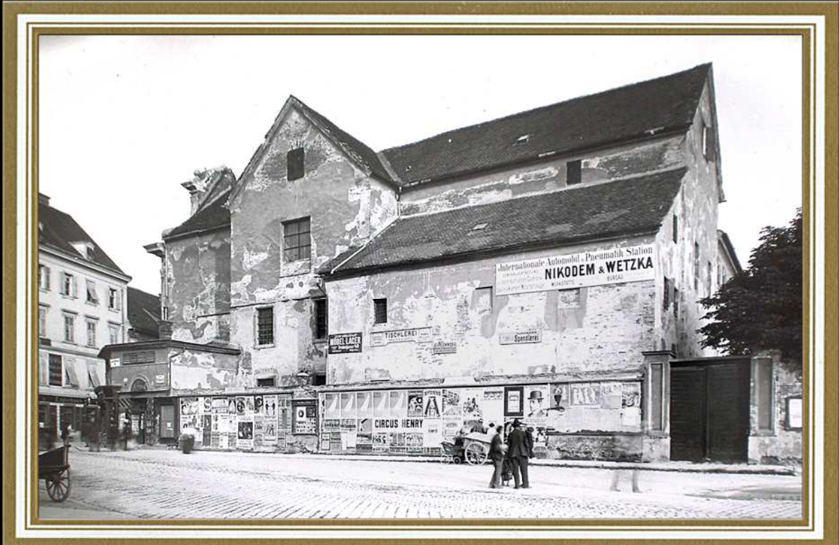
Das später abgerissene Monturdepot am heutigen Andreas-Hofer-Platz