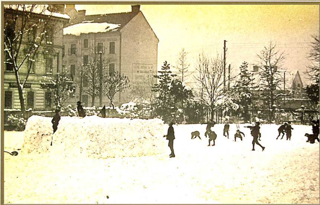
Schneeballschlacht vor der Hirtenschule