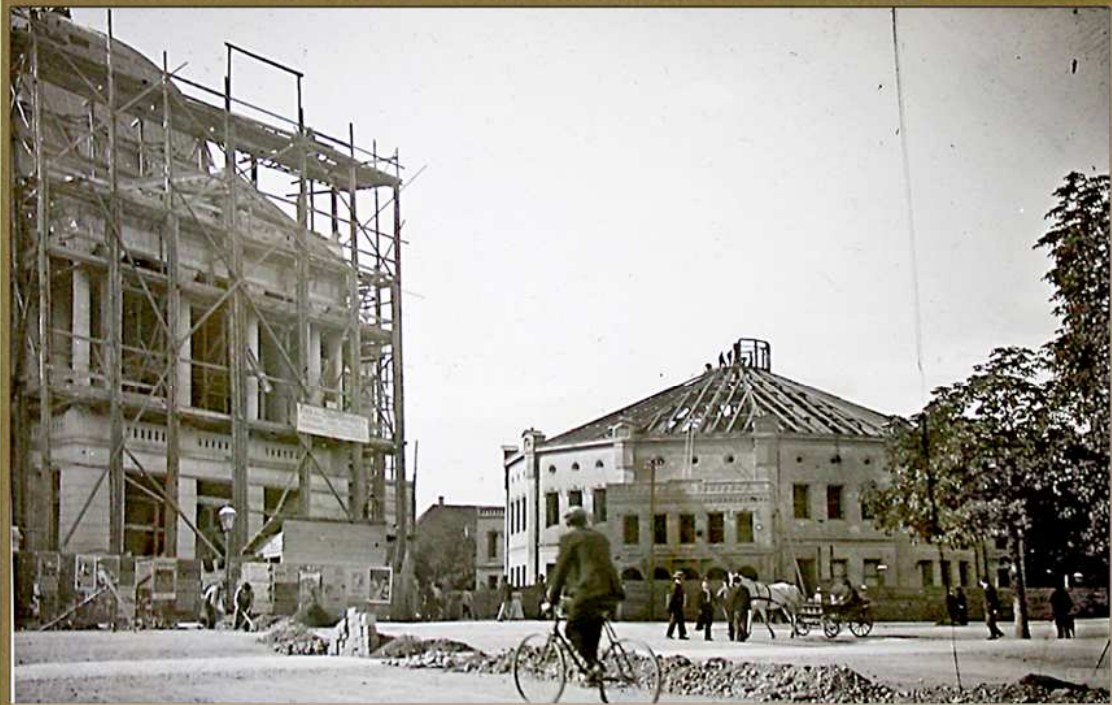
Bau des Opernhauses (li.), im Hintergrund wird das alte Stadttheater abgerissen.