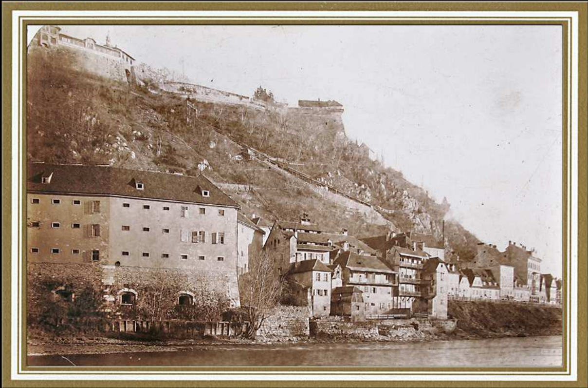
Bau der Schloßbergbahn, eröffnet am 25. November 1894