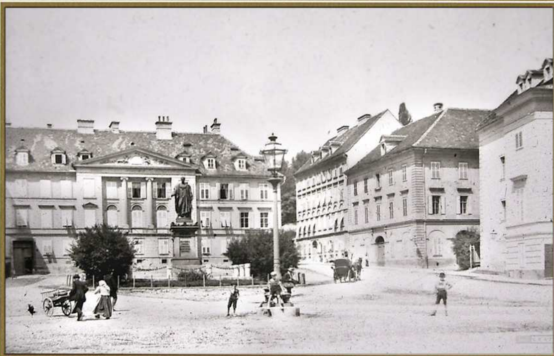
Der Franzensplatz (heute Freiheitsplatz)