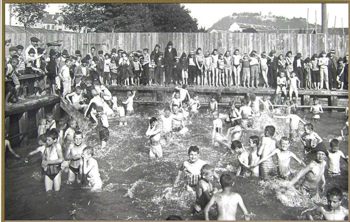
Knabenbad in der Wienerstraße